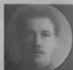
23 Cases. Royal Engineers, 12 Officers, 11 Privates