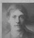
From 6 Members of same Family Male & Female.