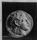
Alexander the Great From 6 Different Medals.